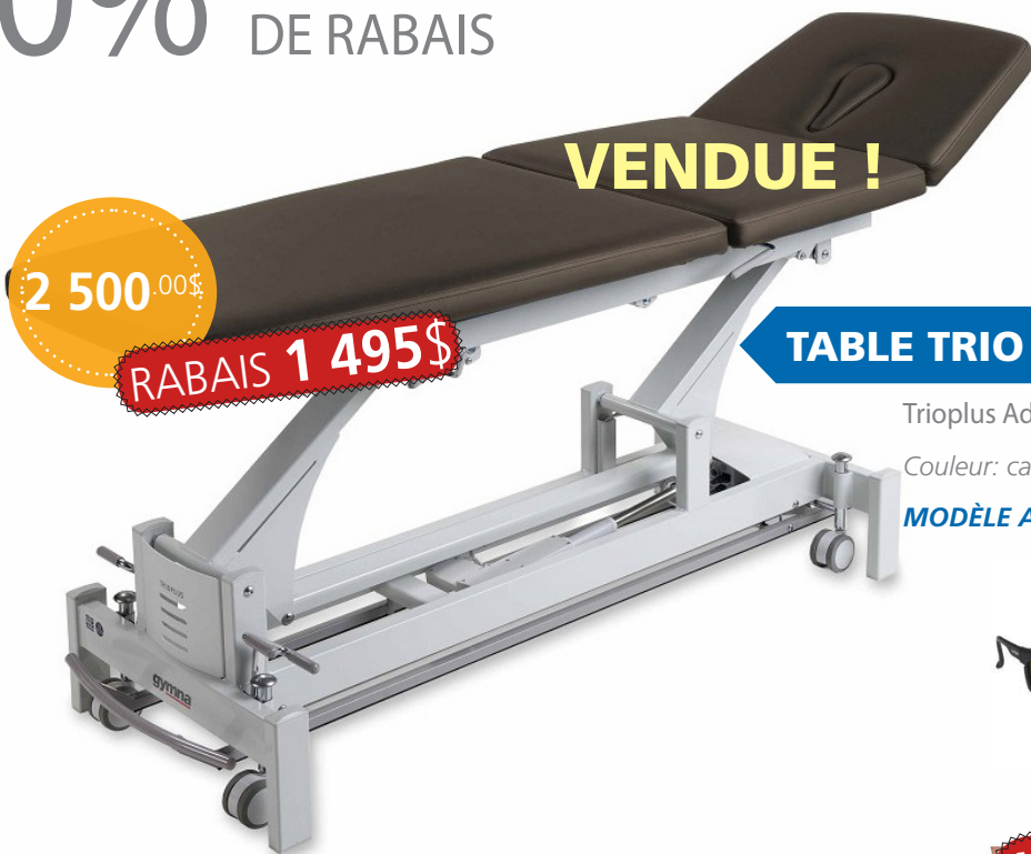
TABLE TRIO PLUS LUXE | GYMNA

Trioplus Advanced (26" largeur) - cadre de commande